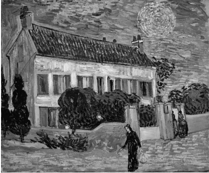
[Beyaz Ev, Gece-1890]

(7) Bir arkadaşına yazdığı mektupta, galaksilerin ilk fotoğraflarını bu eserde gördüğünden söz etmişti. İşte bu gerçeklerden hareket eden astrofizikçi Jean-Pierre Luminet, sanatçının bazı eserlerindeki gökyüzü, yıldız ve gezegenlerini yeniden bilgisayar aracılığıyla yakından incelemiştir. Bunu gerçekleştirirken, öncelikle sanatçının bu tabloları yaparken hangi mekânda olduğunu ve bulunduğu yönü araştırmıştır.