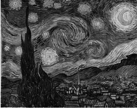
[Saint-Remy-de-Provence Üzerindeki Yıldızlı Gece-1889]

(1) İzlenimciliğin en büyük temsilcilerinden olan Van Gogh'un tablolarına yakından bakıldığında, yıldızlar parlıyor, gezegenler dönüyor. Kimilerine göre, bunlar bunalım içindeki bir sanatçının halüsinasyonları... Kimilerine göre ise, yıldızların ve gezegenlerin tablolarındaki yeri, astronomi bilimine tümüyle sadık.