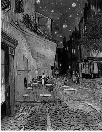
[Aries'te Gece, Kahve Terası-1888, Kova Takımyıldızı]