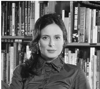
Aitana Sánchez Gijón

Cada semana hablamos con una persona famosa sobre sus intereses literarios. Esta vez entrevistamos a la actriz Aitana Sánchez Gijón.