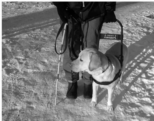
Собака-поводырь в работе