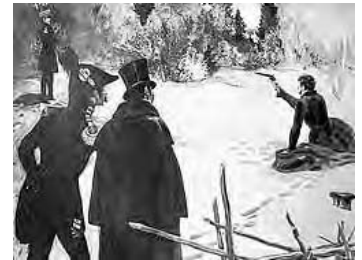
На Черной речке

К 170-летию со дня дуэли Пушкина Государственный музей А.С. Пушкина открывает выставку. Выставка рассказывает об истории дуэли между Александром Пушкиным и Жоржем Дантесом. Центральное место занимают материалы, связанные с дуэлью. Одним из экспонатов будет дуэльный набор 1) Дантеса. На выставку из Франции едут его дуэльные пистолеты, одним из которых на берегу Черной речки в Санкт-Петербурге был смертельно ранен 2) Пушкин.