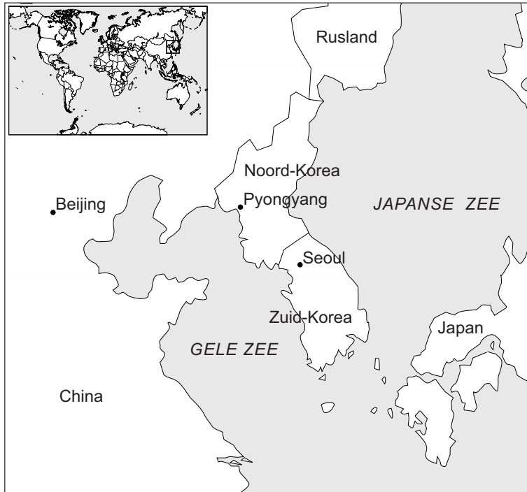
kaart van Noord-Korea en Zuid-Korea