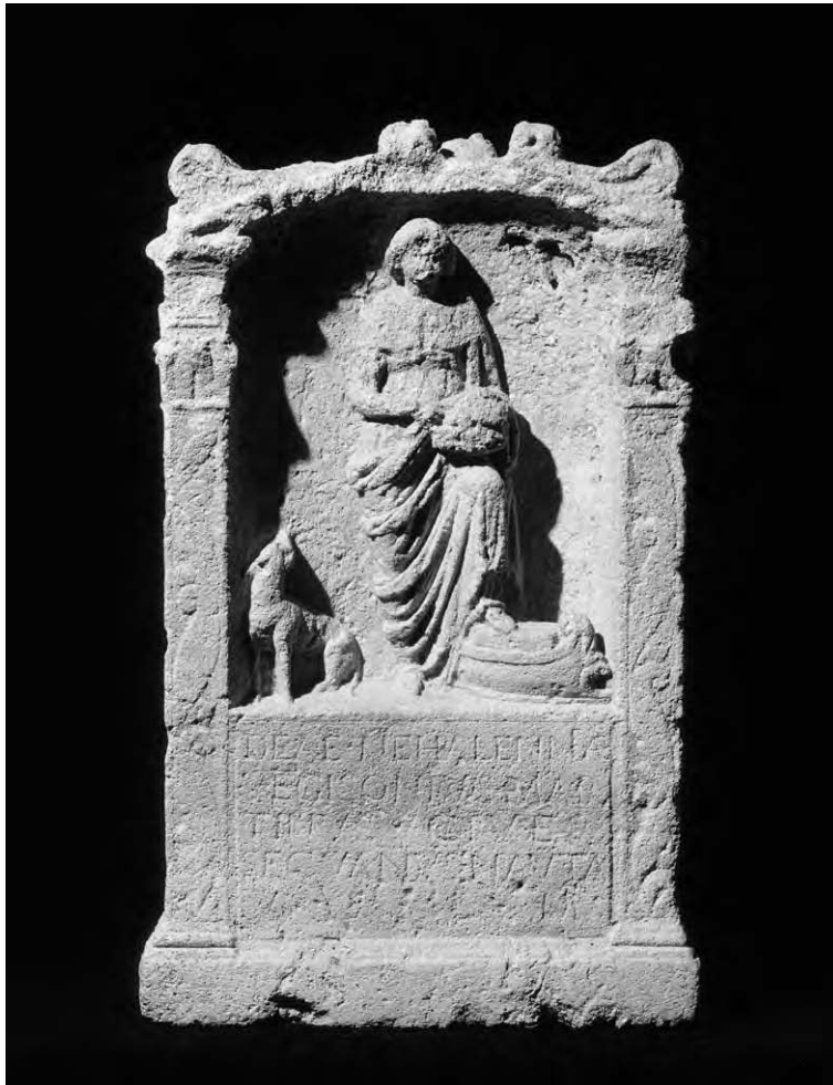
Foto van een votiefsteen (een offersteen die uit dankbaarheid aan een god of godin is beloofd), uit de periode 170-270, gevonden bij Colijnsplaat in Zeeland