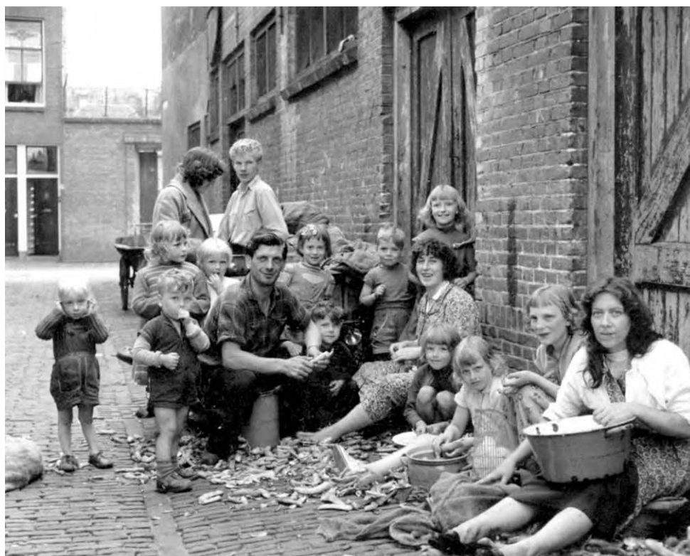
Foto uit 1957 van een gezin dat bonen dopt voor een conservenfabriek in Leiden