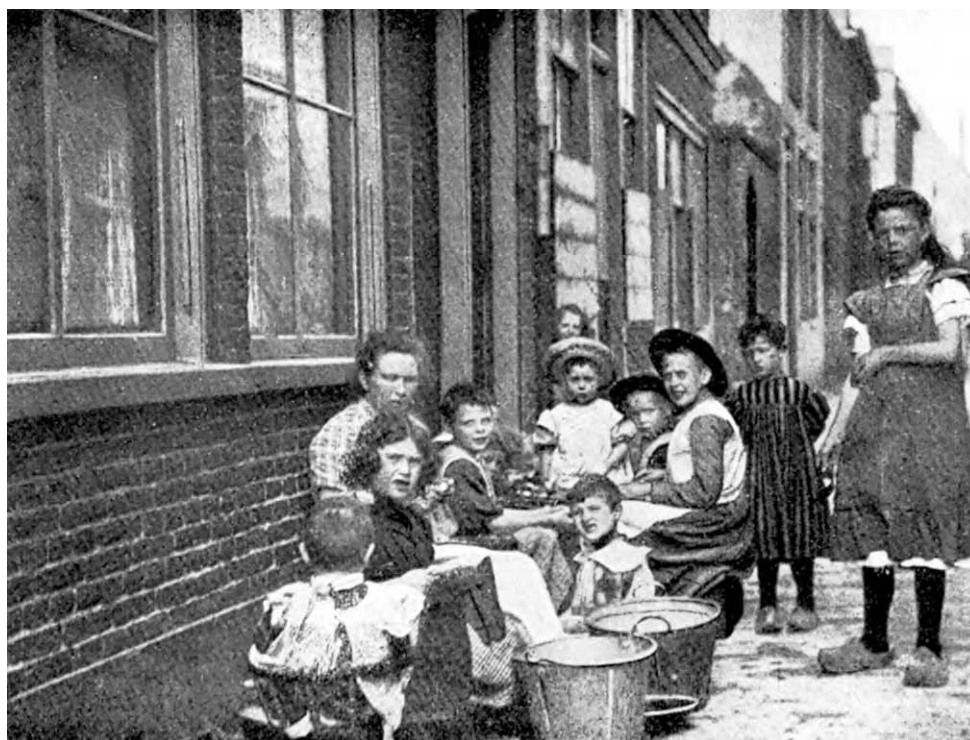
Foto uit 1911 van een uienschilster met helpende kinderen bij haar huis