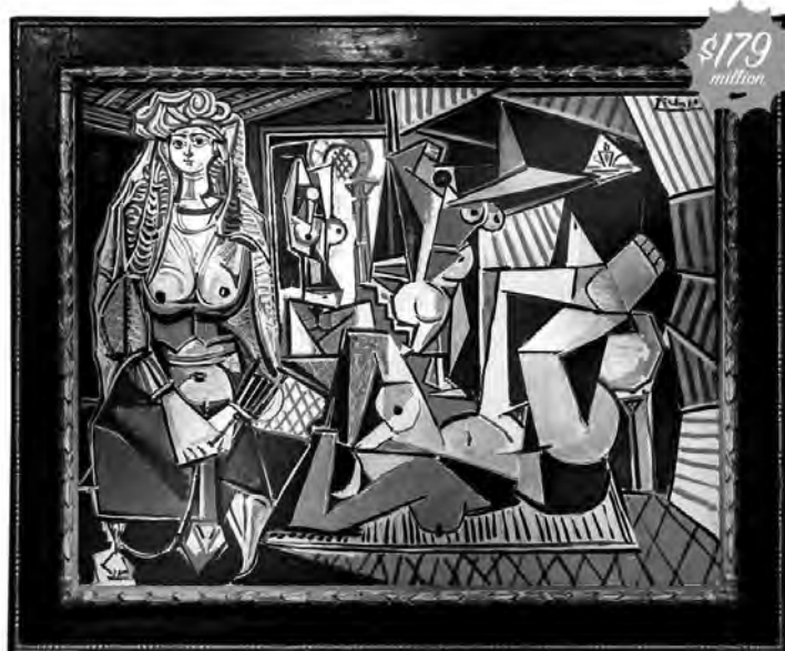
Les Femmes d'Alger (Picasso)

(1) Le 11 mai, Christie's a vendu Les Femmes d'Alger , une toile de Picasso, pour 179,4 millions de dollars, un prix record pour une vente publique. Jusqu'à présent, c'était Francis Bacon qui détenait le record de l'œuvre la plus chère vendue aux enchères avec son triptyque représentant Lucian Freud, vendu pour 142,4 millions de dollars en 2013. Les toiles atteignent des prix encore plus élevés en dehors des salles de ventes. Deux Tahitiennes , de Paul Gauguin, a atteint près de 300 millions de dollars lors d'une transaction privée en début d'année, selon The New York Times . Du jamais-vu pour une œuvre d'art. (2) Ces montants énormes suscitent de nombreuses interrogations, d'autant plus qu'en ce moment les investisseurs du monde entier s'inquiètent de la hausse des actions,