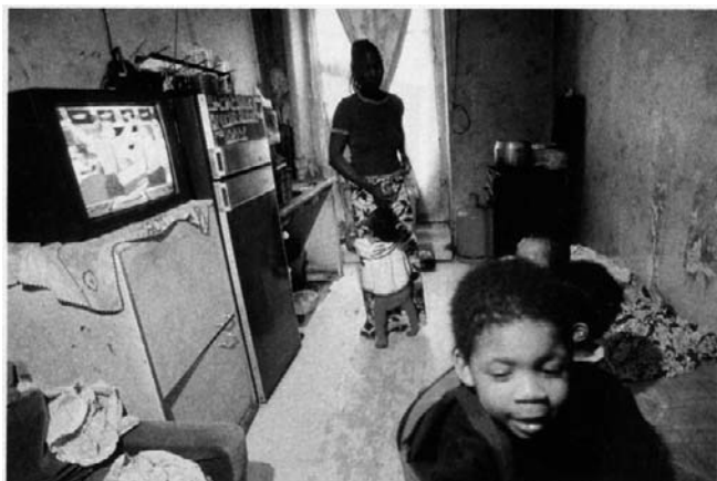
La France peine à loger ses citoyens les plus démunis.

A Paris, 500 enfants souffrent de saturnisme 2) . A Bordeaux, 300 Gitans vivent «oubliés» depuis dix ans dans des baraques insalubres. 850 000 personnes occupent un logement classé «inconfortable». 130 000 ménages s'entassent dans des appartements trop petits. Sans compter les milliers de familles victimes des marchands de sommeil 3) , versant des loyers astronomiques pour se serrer dans leurs logements misérables.