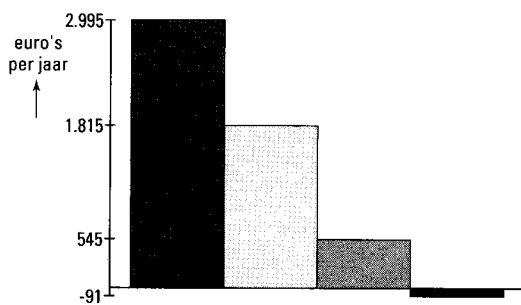
figuur 4 Waar gaat de stijging van het bruto-inkomen naartoe als een baan wordt aanvaard op minimumloonniveau?