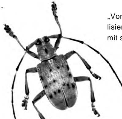
„Vorsicht, Gift!“ signalisiert dieser Bockkäfer mit seiner Farbe

Die Suche nach Arzneistoffen in Wildpflanzen ist schwierig, denn die Forscher wissen oft nicht, welche Arten solche Substanzen enthalten. Künftig könnten ihnen Käfer helfen. Wie Biologen des Smithsonian Tropical Research Institute in Panama herausfanden, suchen vor allem bunte Exemplare 1 Pflanzen auf. Sie nehmen daraus Giftstoffe gegen Fraßfeinde auf und zeigen mit auffälliger Färbung ihre Toxizität an.