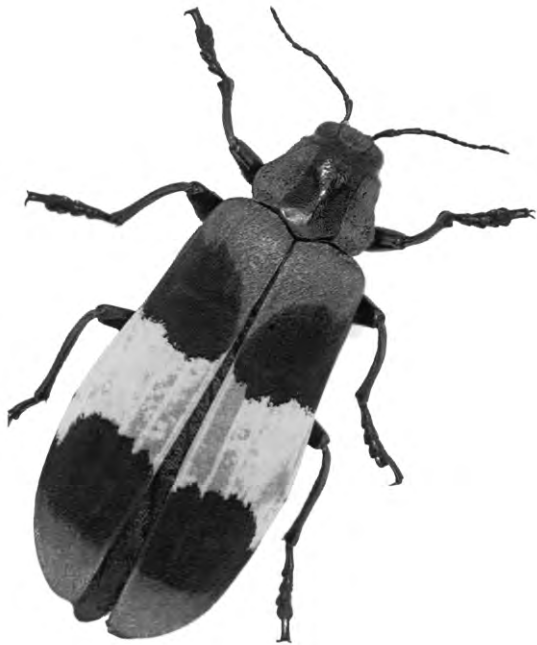
Bunte Käfer können als Wegweiser zu Medizinpflanzen dienen

Die Suche nach Arzneistoffen in Wildpflanzen ist schwierig, denn die Forscher wissen oft nicht, welche Arten solche Substanzen enthalten. Künftig könnten ihnen Käfer helfen. Wie Biologen des Smithsonian Tropical Research Institute in Panama herausfanden, suchen vor allem bunte Exemplare 1 Pflanzen auf. Sie nehmen daraus Giftstoffe gegen Fraßfeinde auf und zeigen mit auffälliger Färbung ihre Toxizität an.