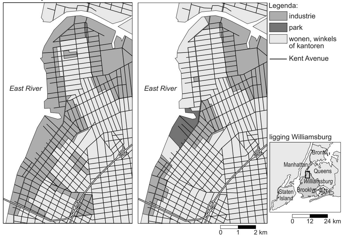
situatie in mei 2005

Williamsburg is door middel van de Williamsburg Bridge rechtstreeks verbonden met Manhattan.