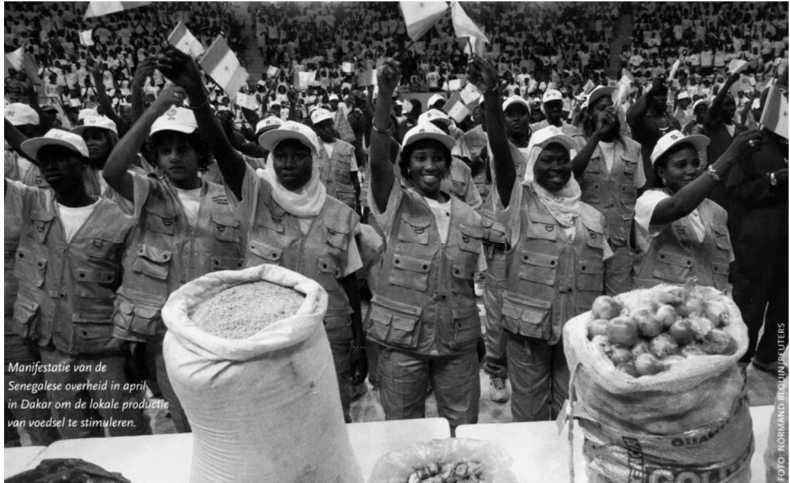
Manifestatie van de Senegalese overheid in april in Dakar om de lokale productie van voedsel te stimuleren.