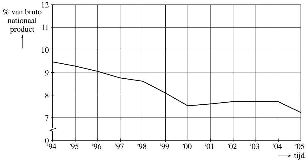
figuur 2 Defensie-uitgaven als percentage van het bnp

Dat een stijging van de defensie-uitgaven toch als een daling kan worden gepresenteerd, komt doordat de economie in China razendsnel groeit en het bnp dus ook.