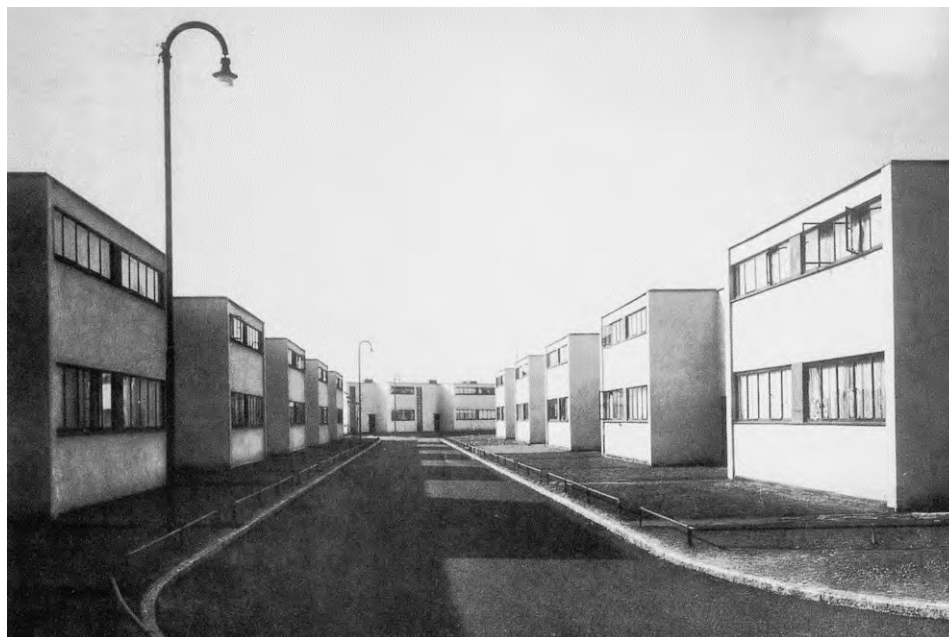
Walter Gropius, woningbouwproject Törten, Dessau 1926-1928

Op figuur 6 zie je een voorbeeld van een modernistische woonwijk uit de jaren twintig van de vorige eeuw. Afgaand op het project in Manchester kun je stellen dat het FAT niet helemaal gelukt is om de modernist in henzelf te doden.