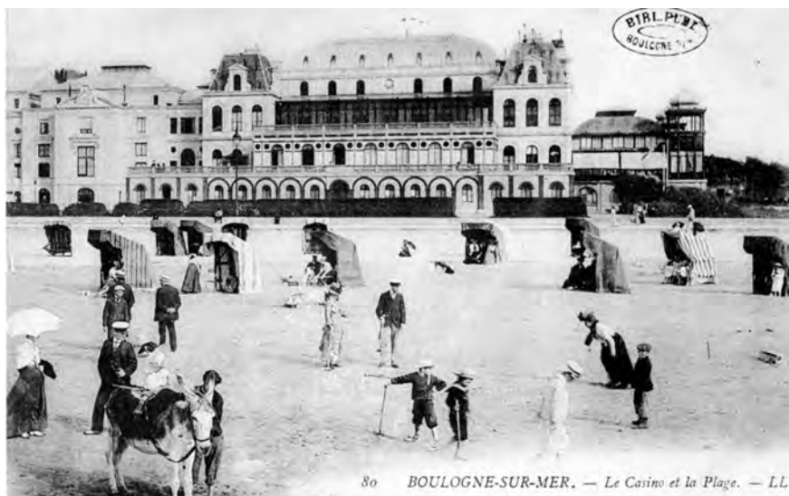
80 BOULOGNE-SUR-MER. — Le Casino et la Plage.