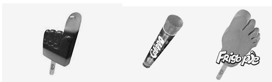
el Frigo dedo

(7) Mi historia en el mundo de los helados es la historia de una persona apasionada por el conocimiento. Es algo que heredé de mis primeros jefes y que ahora, como veterano, intento transmitir a los más jóvenes. Porque un conocimiento amplio, en cualquier momento de la vida, te 50 puede venir como anillo al (Frigo) dedo.