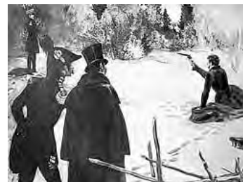
На Черной речке

К 170-летию со дня дуэли Пушкина Государственный музей А.С. Пушкина открывает выставку. Выставка рассказывает об истории дуэли между Александром Пушкиным и Жоржем Дантесом. Центральное место занимают материалы, связанные с дуэлью. Одним из экспонатов будет дуэльный набор 1) Дантеса. На выставку из Франции едут его дуэльные пистолеты, одним из которых на берегу Черной речки в Санкт-Петербурге был смертельно ранен 2) Пушкин.