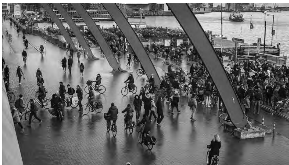
Shared Space achter Amsterdam CS, waar veel soorten verkeer elkaar kruisen

45 Alleen een enkele brommer of snorfiets scheurt er nog weleens doorheen. Voor de rest: heel erg goed."