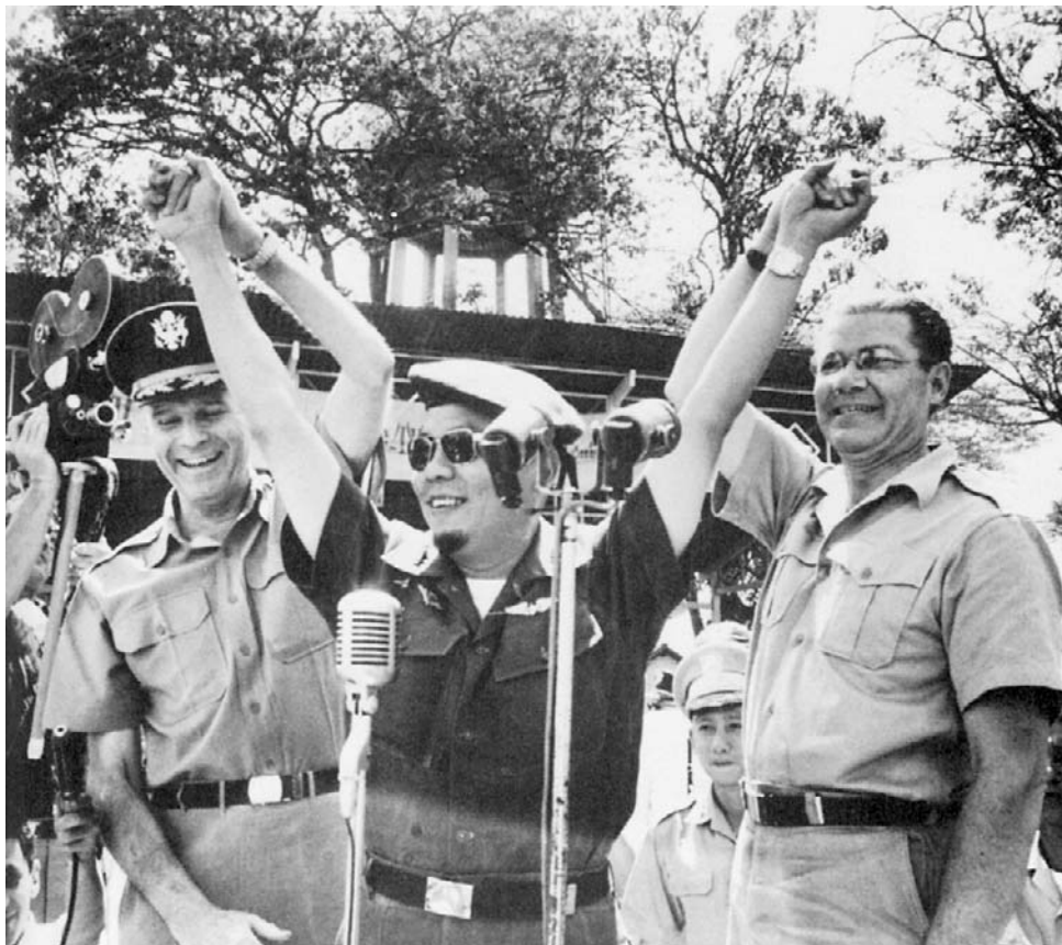
Foto gemaakt in maart 1964 in Saigon. Van links naar rechts de Amerikaanse generaal Maxwell Taylor, generaal Nguyen Khan (één van de militairen die na de moord op Diem aan de macht was in Zuid-Vietnam) en de Amerikaanse minister van defensie Robert McNamara