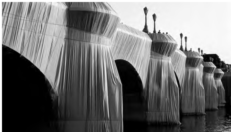
Le Pont-Neuf à Paris recouvert de toile (1985)

(1) Que se passe-t-il dans la soirée du 22 juin 1962, rue Visconti, près de la Seine, à Paris ? On ne peut plus passer : une énorme barricade faite de 80 bidons d'essence et d'huile de moteur barre la rue. C'est un coup monté secrètement par Christo et baptisé « Rideau de fer » pour protester contre l'édification du mur de Berlin, en Allemagne.