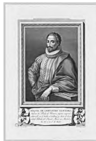
Miguel de Cervantes

(1) Todos los años se celebra en Cataluña el Día del Libro el 23 de abril. Como coincide con la festividad de San Jorge o Sant Jordi, que tanto nos protege y patrocina, algunos atribuyen la fiesta al santo, y otros aclaran que lo que se conmemora es que en esta fecha, en 1616, murieron don Miguel de Cervantes y William Shakespeare. (2) Aunque en rigor la coincidencia sólo es aproximada por un desfase en el calendario inglés y español de aquella época, no deja de ser impresionante pensar que murieron juntamente los dos autores cuya permanencia al día de hoy es más notable. El Quijote es el libro más vendido esta temporada y no hay autor teatral más conspicuo que Shakespeare en nuestros escenarios. (3) No es menos notable, sin embargo, que las coincidencias entre ambos acaben en la triste circunstancia de haber estirado la pata al alimón 1 . El resto es divergencia.