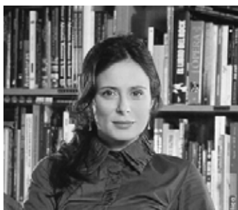
Aitana Sánchez Gijón

Cada semana hablamos con una persona famosa sobre sus intereses literarios. Esta vez entrevistamos a la actriz Aitana Sánchez Gijón.