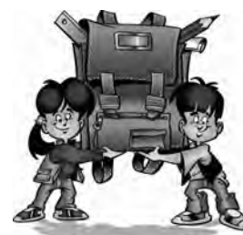
Наш школьный ранец

Врачи разработали нормы веса ранцев для учеников разных классов, но донести 5 информацию до учителей, очевидно, забыли. И как может ранец моего сына-пятиклассника весить рекомендованные 2,5 кг, если у него в день пять разных предметов и по каждому нужны учебник и тетрадь?