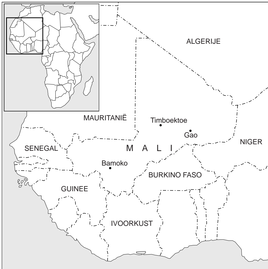
figuur 7 Sahelzone