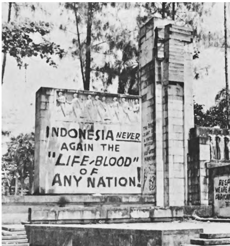
Foto van het Van Heutszmonument in Batavia, 1945