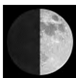
eerste kwartier 50% zichtbaar