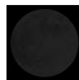
nieuwe maan 0% zichtbaar

De volgorde waarin deze schijngestalten voorkomen, is dus altijd: eerst nieuwe maan, dan eerste kwartier, dan volle maan en daarna laatste kwartier. Daarna volgt opnieuw nieuwe maan, enzovoort.