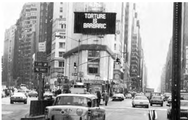
Martelen is barbaars