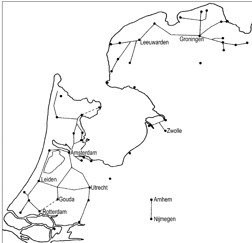
Trekvaartnetwerk na 1655