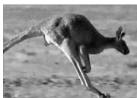
foto 5 laagste punt