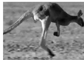
foto 4 net op de grond