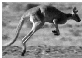
foto 3 hoogste punt