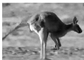
foto 6 opnieuw afzet