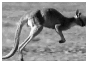
foto 2 net los van de grond