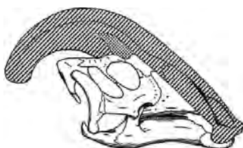
hoorn vrouwelijke Parasaurolophus