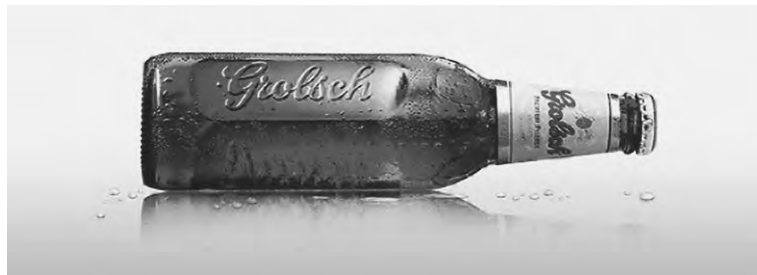
Een oude bekende in een nieuwe verpakking, Grolsch .

Advertentie, Tukkersbode (20 januari 2007)