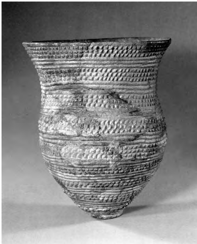
Foto van een klokbeker van gebakken klei gevonden in Barneveld. Door de vondst van dit soort klokbekers wordt de samenleving die zich omstreeks 2.000 v. Chr. ontwikkelt de "Klokbekercultuur" genoemd. Deze klokbeker met wikkeldraadmotief is 44 centimeter hoog: