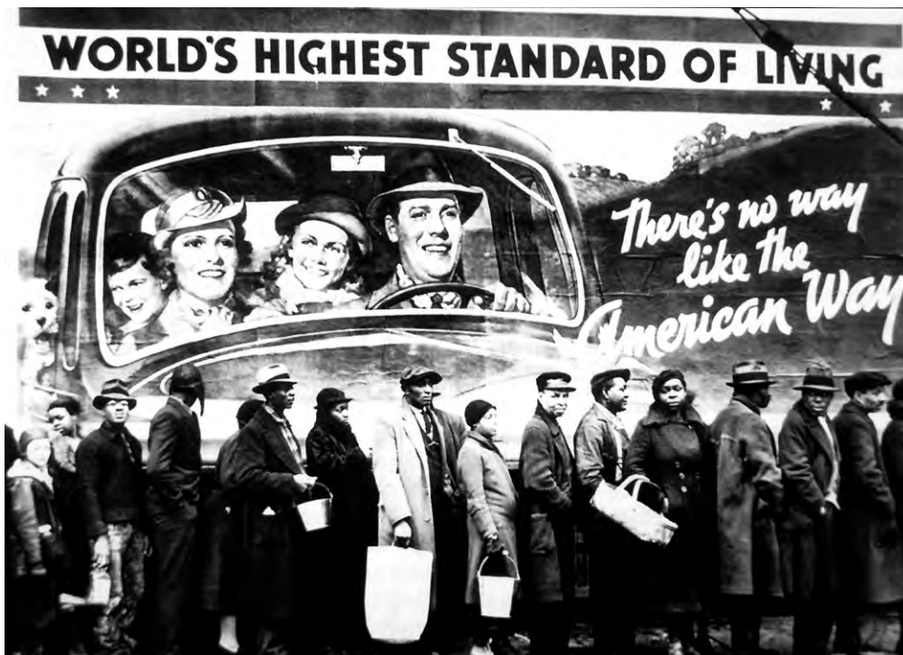
Foto van een rij wachtenden voor een uitkeringsinstantie, gemaakt in 1937 in de Verenigde Staten