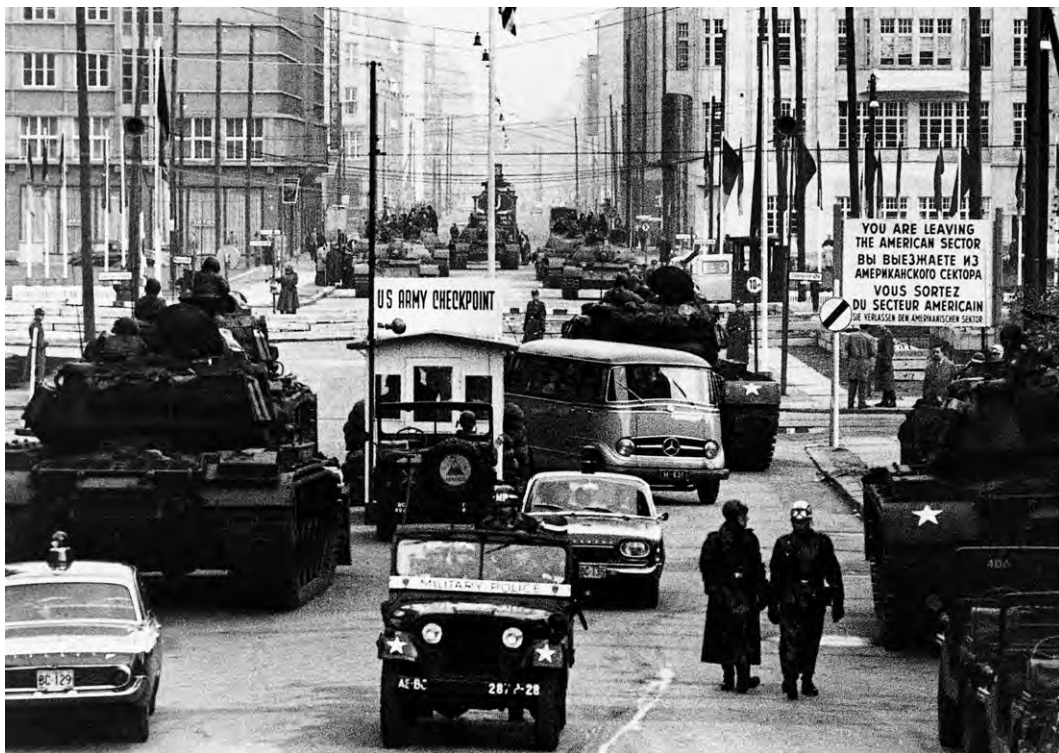
Foto uit oktober 1961 van de grensovergang Checkpoint Charlie in Berlijn