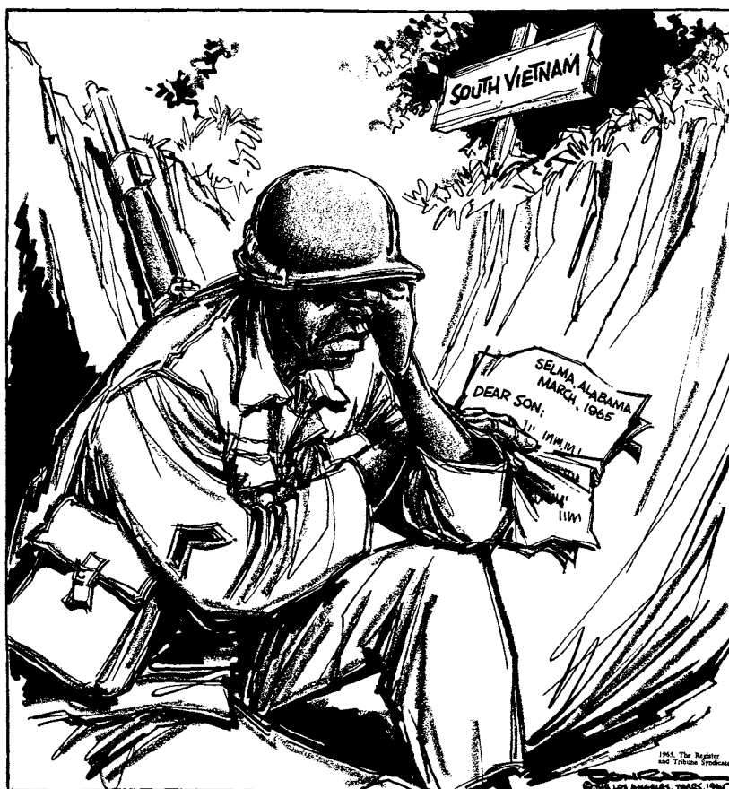
A LETTER FROM THE FRONT

Paul Conrad maakt naar aanleiding van gebeurtenissen op 7 maart 1965 in de Amerikaanse plaats Selma een prent voor de Los Angeles Times