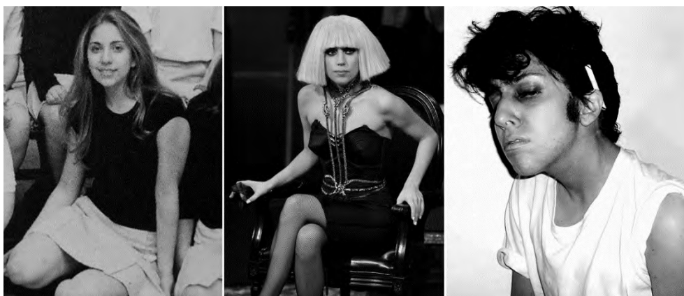
Germanotta als zichzelf, als Lady Gaga en als Jo Calderone

Tijdens een show in 2011 verscheen Germanotta opeens niet als Lady Gaga, maar als een mannelijk alter ego genaamd Jo Calderone.