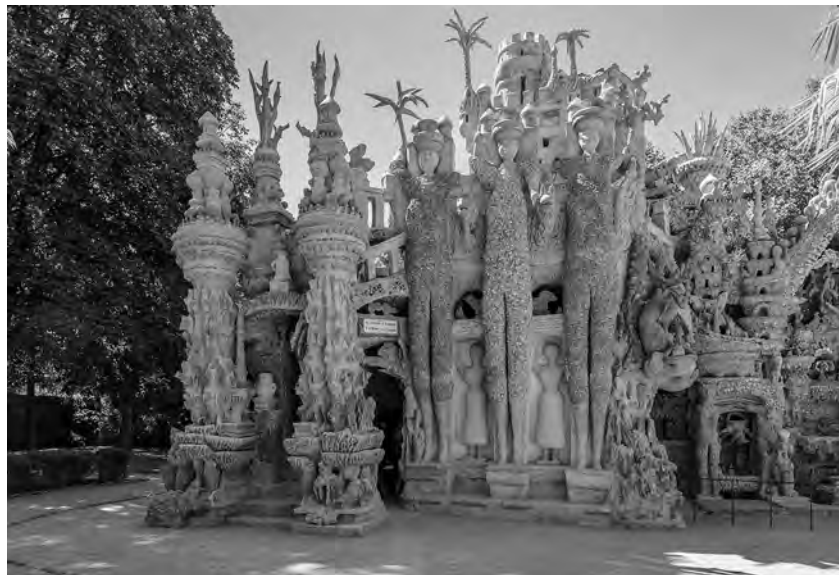
Le « Palais idéal »