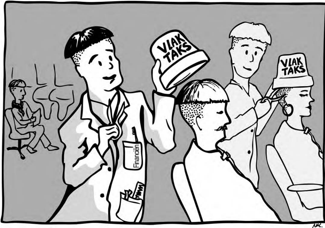
bron 7 een cartoon naar aanleiding van het vlaktaksvoorstel