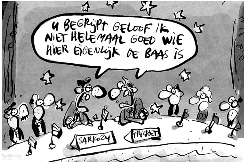
Tekst cartoon u begrijpt geloof ik niet helemaal goed wie hier eigenlijk de baas is