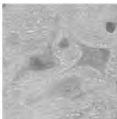
cellen met het normale AR-gen